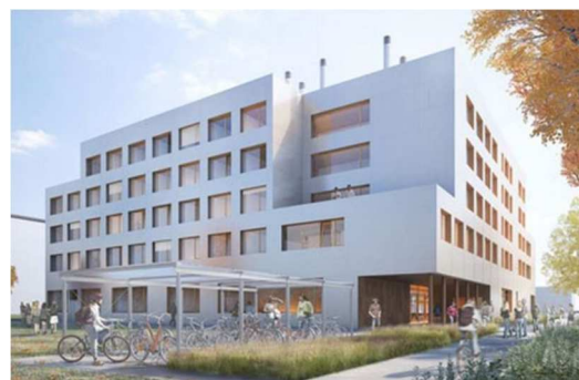
Bâtiment Max Weber (W)